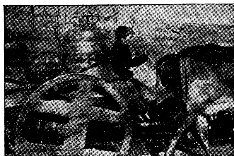
La guerra civil ha demostrado a los campesinos que los caciques no representaban nada.

El proyecto de Reforma que se anuncia va a nacer cuando la guerra civil anuncia el parto de la nueva organización económica, social y política de España. (Pasa a la cuarta página)