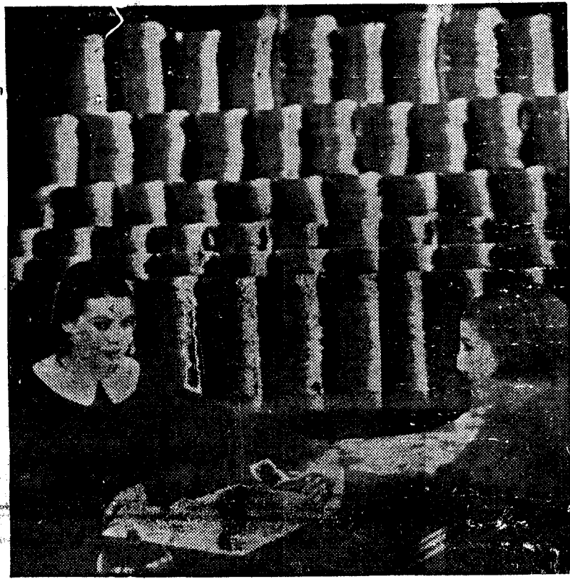
Las Milicias de Retaguardia no serán una organización de detectives, pero sí car pesetas de bajo los ladrillos.

idad con que produce los acontecimientos y plantea los problemas no permite "rectificar a tiempo" posturas ambigüas, y por eso descubre en juego la trampa, mejor de los que juegan mental y políticamente con dos barajas. De los que están averazados a ganar siempre. (Pasa a la tercera página)